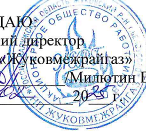
ГРАФИК проведения ТО ВДГО/ВКГО

Калужская область, Жуковский район, город Кременки, улица Ленина, дом 8, корпус 7 28.05.2025